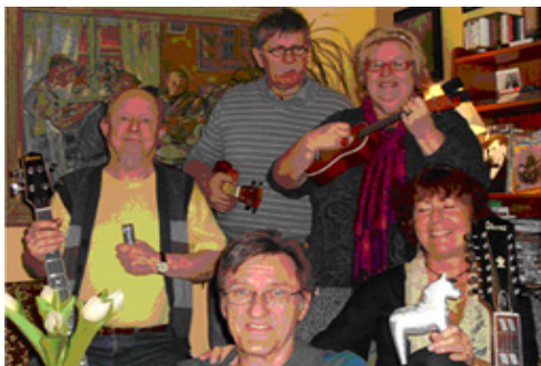
Folkvisor, schottis, vals och sång på svenska och på Rättviksmål