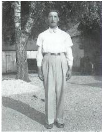
Klar til bal i skoven.